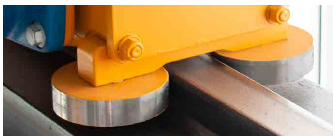
Rodillos guía en la viga carril superior