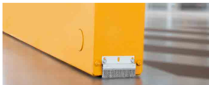
Ruedas inferiores sin raíl guía