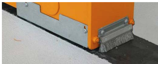
Ruedas inferiores sin raíl guía